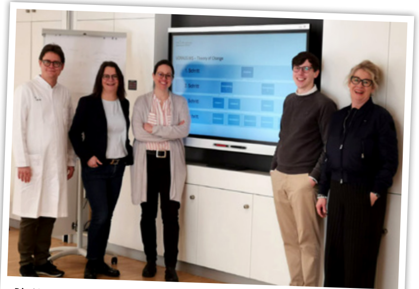
Die Verantwortlichen des Projekts „VORAUS.MS“ engagieren sich für eine vorausschauende Pflegeplanung und Palliativversorgung für wohnungslose Menschen.

Diesem Problem widmet sich ein interdisziplinäres Konsortium der Zentralen Einrichtung Palliativmedizin des Universitätsklinikums Münster (UKM), des Mobilen Dienstes im Haus der Wohnungslosenhilfe, des Palliativnetzes Münster und der Ansprechstelle im Land Nordrhein-Westfalen zur Palliativversorgung, Hospizarbeit und Angehörigenbegleitung (ALPHA NRW) im Citizen Science-Projekt „VORAUS.MS“. Im Mittelpunkt steht eine Verbesserung der vorausschauenden Pflegeplanung und Palliativversorgung für wohnungslose Menschen. Das Projekt sammelt und entwickelt Ideen zur Verbesserung der Situation. „Wohnungslose Personen brin-