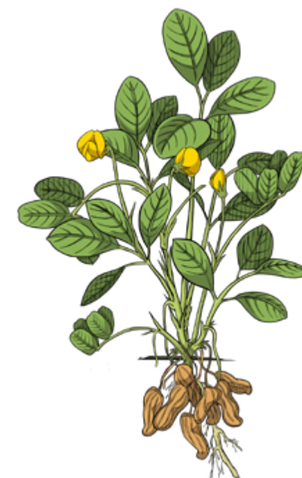
Die Erdnuss gehört zur Familie der Fabaceae, die im Mittelpunkt der Ausstellung im Botanischen Garten steht. Illustration: Bjoern von Schulz

Die Ausstellung „Von Bohne, Erdnuss und Mimose – fabelhafte Fabaceae“ wird am 9. Juni mit einer öffentlichen Führung um 11 Uhr zur Woche der Botanischen Gärten (8. bis 16. Juni) eröffnet. Sie ist bis Ende Oktober zu sehen. Interessierte können im Ausstellungszeitraum weitere Führungen buchen. Der Botanische Garten ist in den Sommermonaten täglich von 8 bis 19 Uhr geöffnet.