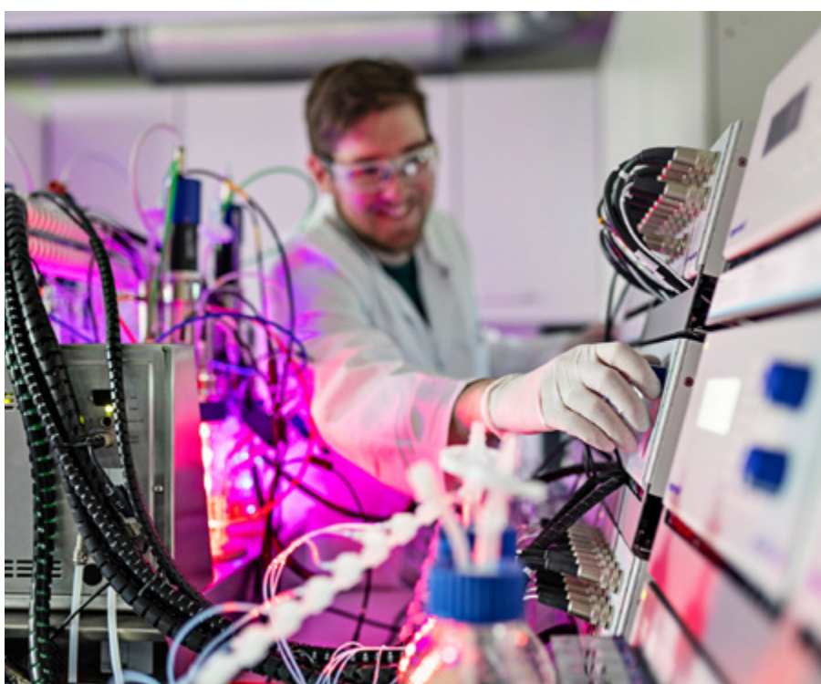
Bevor Ergebnisse aus der Forschung den Sprung in die gesellschaftliche oder wirtschaftliche Anwendung schaffen, gibt es manche Hürde zu überwinden. Ein neuer Validierungsfonds der Universität bietet Unterstützung.