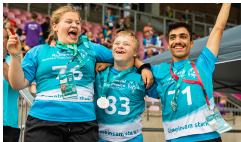
Gewinnen macht Spaß, bei den Special Olympics NRW steht aber das gemeinsame Sporttreiben und die Sichtbarkeit im Vordergrund.