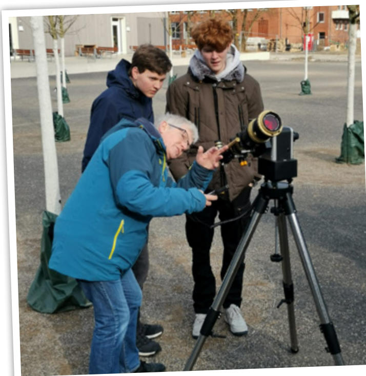
Das Team des Projekts „Electronically Augmented Astronomy“ möchte der städtischen Bevölkerung mit kostengünstigen Hightech-Beobachtungssystemen ein neues Fenster ins Universum öffnen.

Die Jury hob besonders das Zusammenwirken von Forschung und Bildung in diesem Projekt hervor, zu dem auch begleitende Lehrveranstaltungen zu Themen