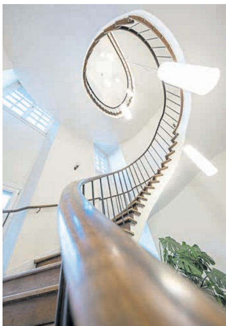
Die geschwungene Holzterrasse im Eingangsbereich stammt aus der Zeit des Wiederaufbaus nach dem Zweiten Weltkrieg.