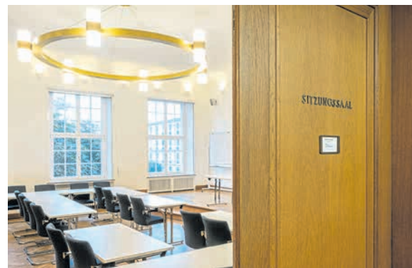
Der Sitzungssaal in der ersten Etage heißt „Alter Gerichtssaal“. Die Beleuchtung an den Wänden stammt aus der Zeit, als hier das Verwaltungsgericht tagte. Der Kronleuchter ist nach den Vorgaben des Denkmalschutzes ergänzt worden, um die Anforderungen an einen Seminarraum zu erfüllen.

hängen hier zottige Felle von so manchem erlegten Tier. Solche Trophäen findet man nur in vornehmen Häusern, denn die Jagd ist ein Privileg der hohen Herren.“