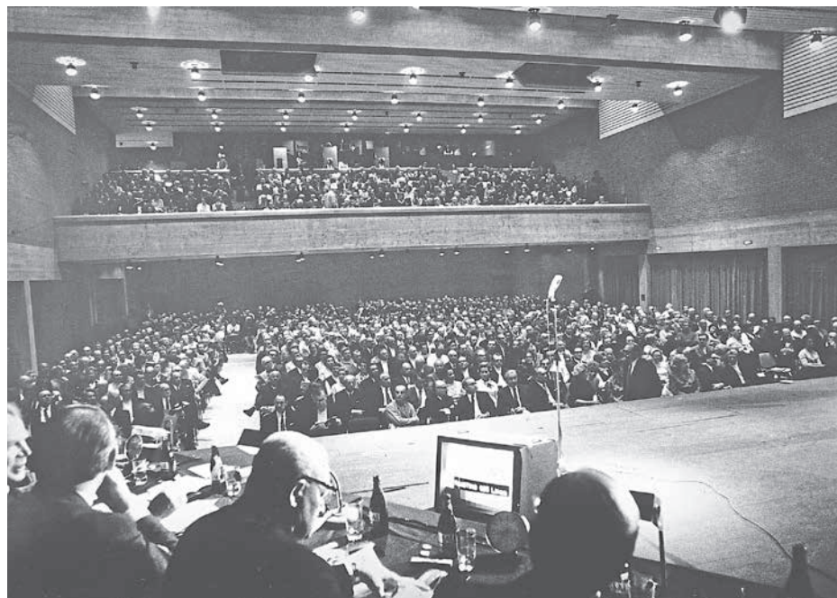
Weltpremiere: Die erste medizinische Telekonferenz erreichte rund 25.000 Ärzte in zahlreichen Ländern.

Die Epoche, in der die Telemedizin sich anschickte, Realität zu werden, fiel mit einer beispiellosen Fortschrittsbegeisterung zusammen. Diese Zukunftswelle, die mit der Futurologie eine eigene Wissenschaft hervorbrachte, erfasste bald auch die deutsche Medizin.