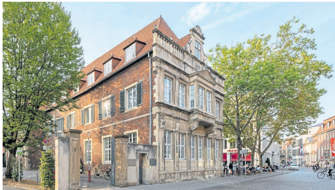
Der Heereman'sche Hof an der Königsstraße diente einst westfälischen Adelsfamilien als Wohnsitz, heute ist die WWU Weiterbildung in dem historischen Gebäude untergebracht.