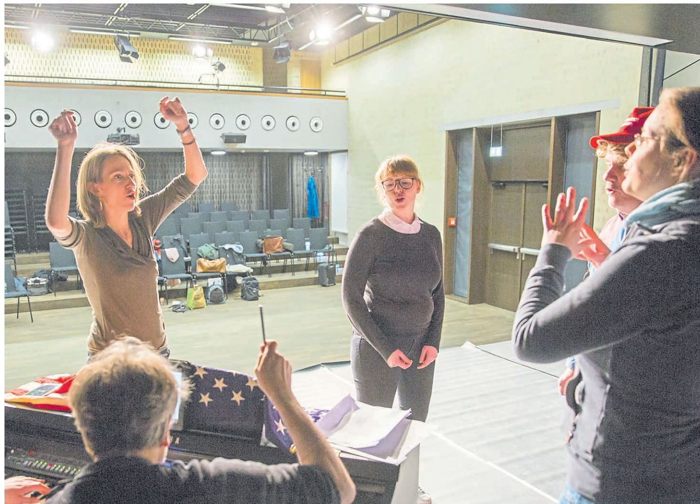
Die „English Drama Group“ bei ihren Proben für die Eröffnungswoche der neuen Studiobühne.

Die Hühner blieben, ihre Wirkstätte aber wurde 2013 abgerissen. Fünf Jahre lang mussten die Theatermacher in ein Provisorium an der Scharnhorststraße ausweichen, bis die Studiobühne am Domplatz als eigenes Modul des neu erbauten Philosophikums wieder auferstand. Das Warten hat sich gelohnt: Die Tontechnik ist top, und die Beleuchtung wurde automatisiert. Damit sind die Zeiten vorbei, in denen für passendes Ambiente auf der Bühne per Hand Farbfolien vor Scheinwerfer geklemmt werden mussten. Wie beim Vorgängerbau haben auch hier 140 Besucher Platz, wobei der Zuschauerraum ebenfalls bespielt werden kann.