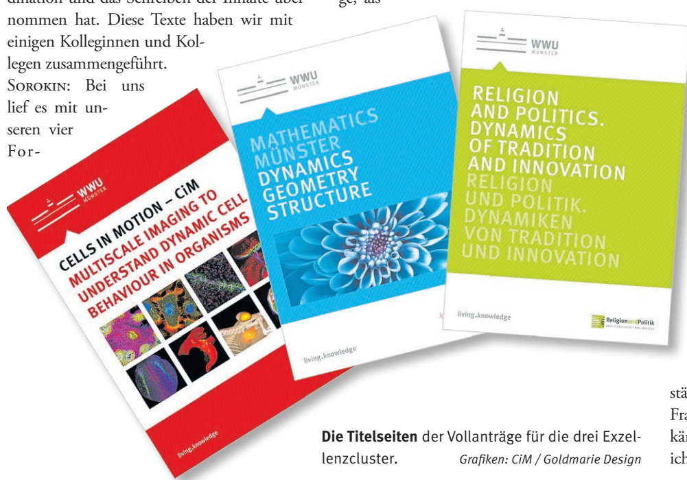
Die Titelseiten der Vollerträge für die drei Exzellenzcluster. Grafiken: CIM / Goldmarie Design

Eine ausführliche Version des Interviews lesen Sie online unter: http://go.wwu.de/ly31e