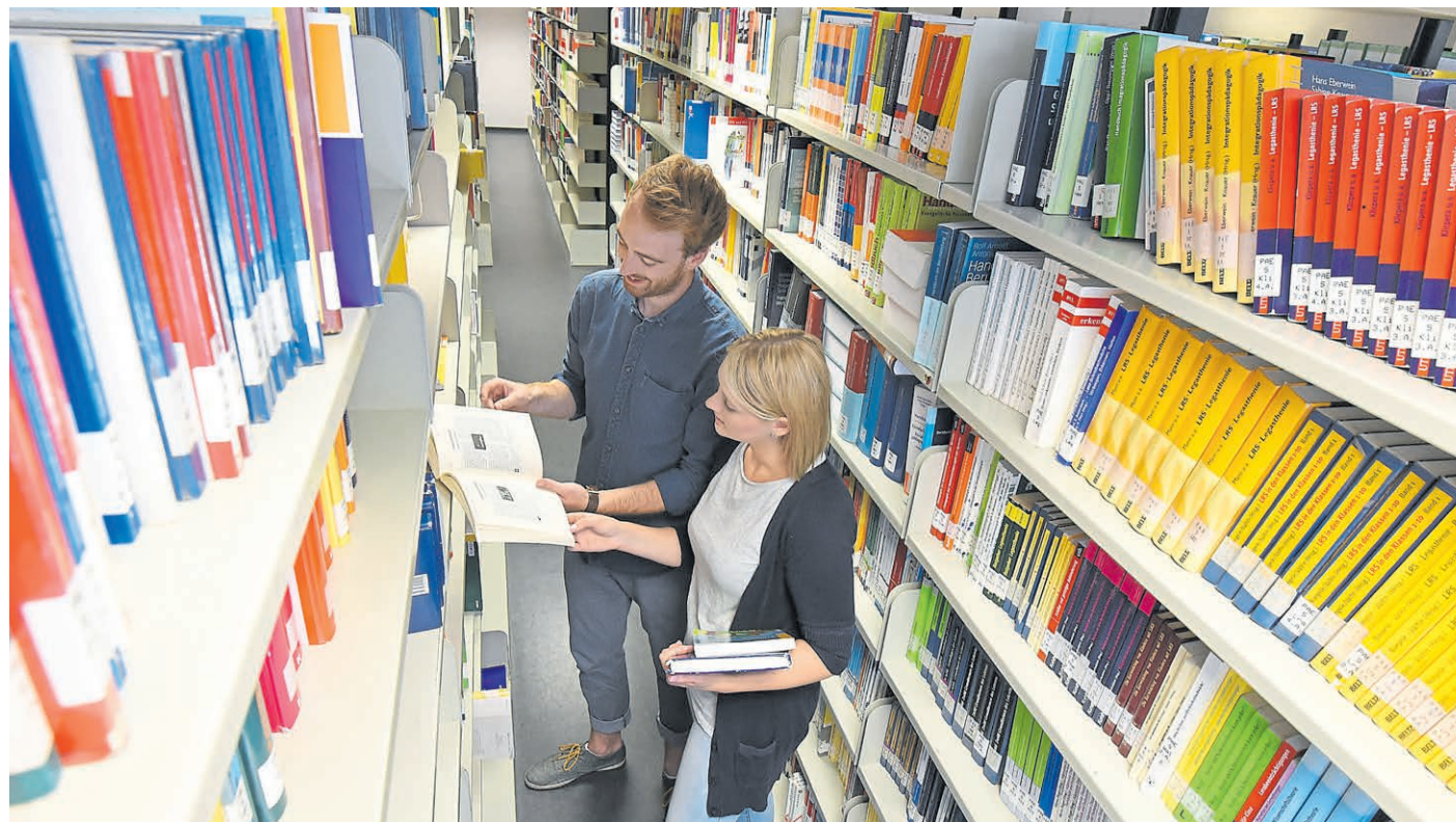
Literaturrecherche oder Bibliotheksaufsichten zählen unter anderem zu den Aufgaben studentischer Hilfskräfte.