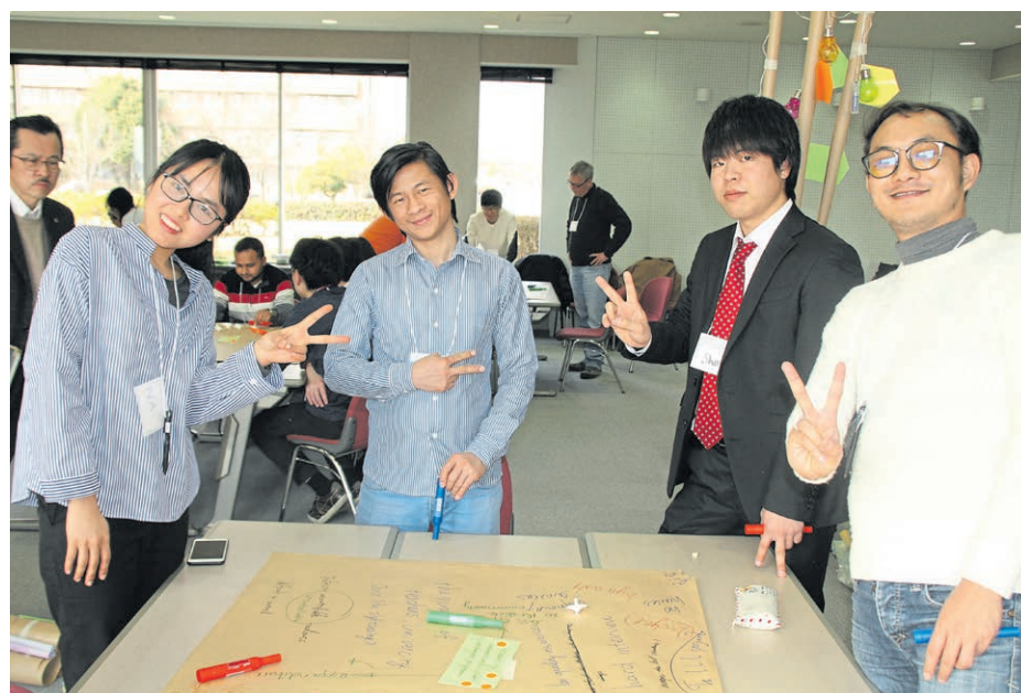
Szene aus einem „Ideen-Mining“-Workshop in Hiroshima.