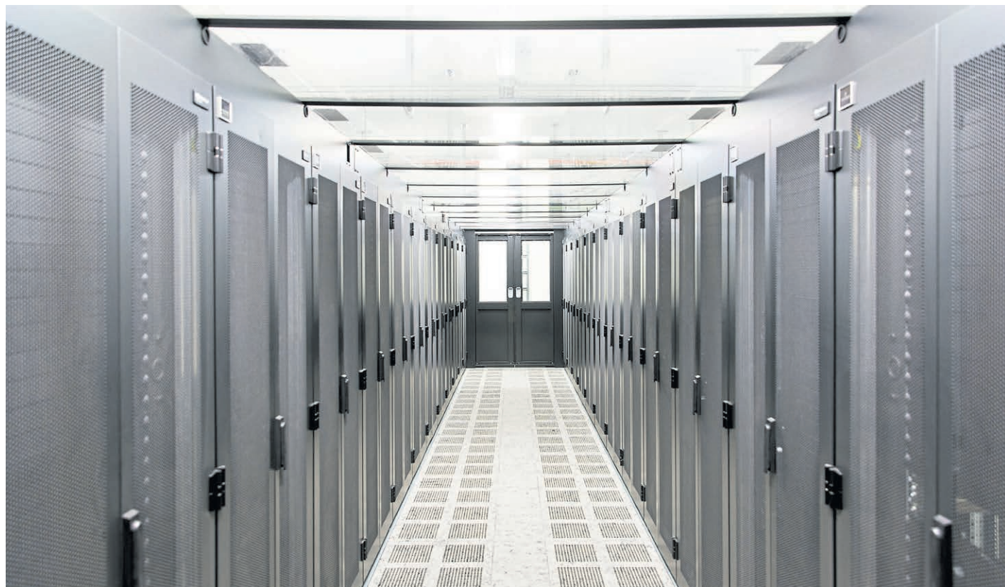
Im neuen Serverraum an der Einsteinstraße findet die geplante Forschungsdateninfrastruktur der WWU Platz.

Bereits 2013 hat die Deutsche Forschungsgemeinschaft (DFG) die Sicherung und Auf-