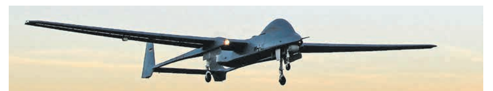
Eine Aufklärungsdrohne der Bundeswehr.

Auch der französische Historiker und Philosoph Michel Foucault greift das