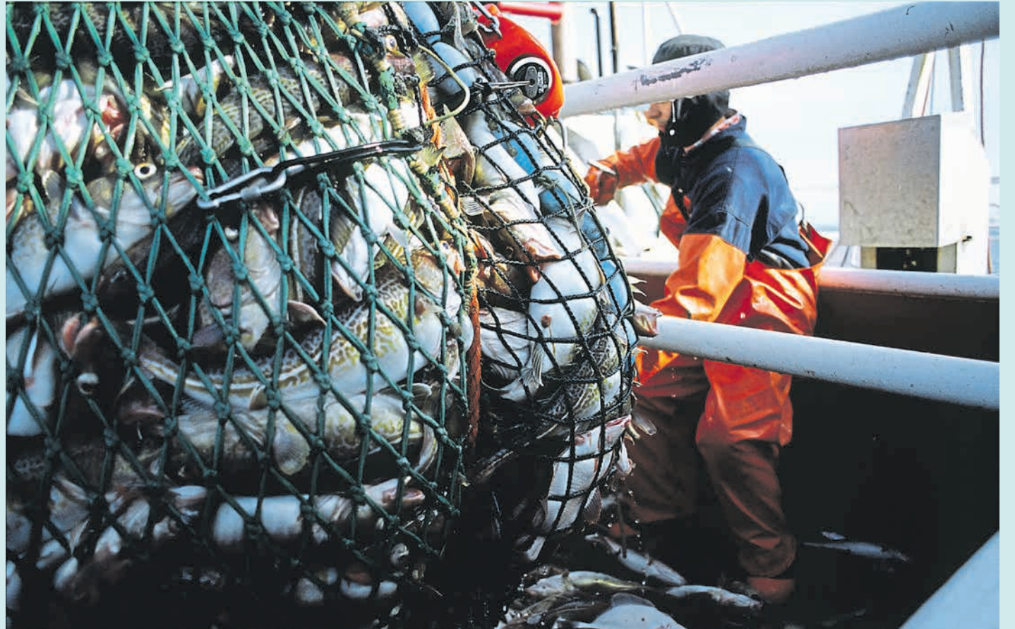
Die Meere werden wegen des Anstiegs der Weltbevölkerung als Nahrungsquelle an Bedeutung gewinnen.

Darüber hinaus existieren zahlreiche Akteure und Institutionen, die sich nur mangelhaft untereinander abstimmen. Das glo-