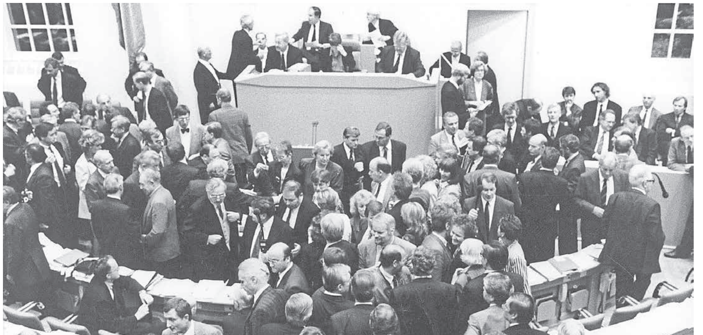
Über viele Jahre Dreh- und Angelpunkt politischer Entscheidungen: Der deutsche Bundestag stimmte 1991 – damals noch im Bonner Wasserkloster – über den Umzug des Parlaments nach Berlin ab.

Änderungen in den Geschichtsbüchern wird es wohl nicht geben müssen. Aber bei der Beurteilung langfristiger Vorgänge wird man womöglich genauer sagen können, wie in bestimmten Situationen entschieden wurde und warum bestimmte Entscheidungen getroffen wurden – oder eben gerade auch nicht. Auch die Frage, warum etwas zu diesem Zeitpunkt so entschieden wurde und später oder früher ganz anders, kann man dann vielleicht besser erklären. Es geht uns aber schon auch darum, Geschichte anders zu beschreiben und zu verstehen, als dies etwa bei der klassischen Politikgeschichte der Fall ist. Diese geht ja von getroffenen Entscheidungen als historischen Ereignissen aus und fragt nach deren Zustandekommen und den Folgen sowie warum dieser oder jener Politiker diese oder jene Entscheidung gefällt hat. Wir dagegen interessieren uns aber gerade auch für solche Fälle von Entscheiden, bei denen gar keine Entscheidung getroffen wurden. Meiner Beobachtung nach dürfte das wohl sogar die große Mehrheit sein.