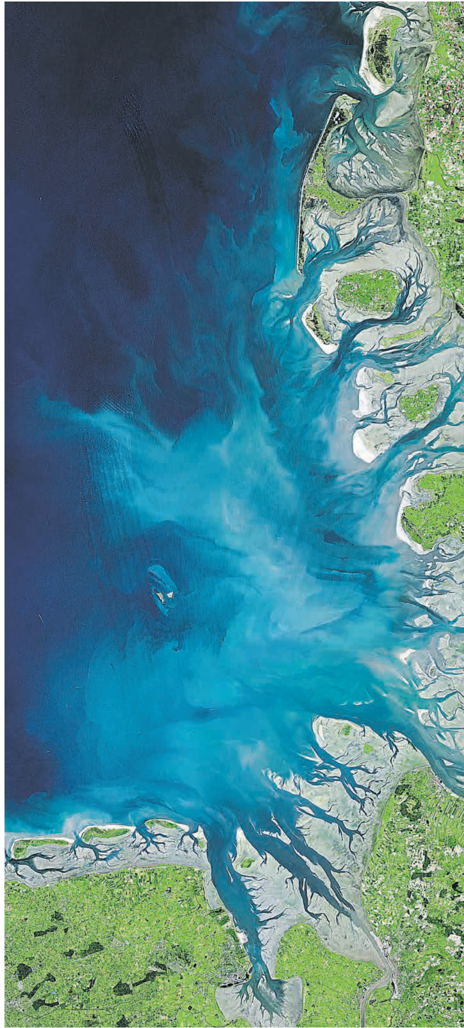
Faszinierende Küste: Auch mit Blick auf die Nordsee empfehlen Experten eine behutsame und nachhaltige Nutzung der Meere.

Ihr Norbert Robers Norbert Robers (Pressesprecher der WWU)