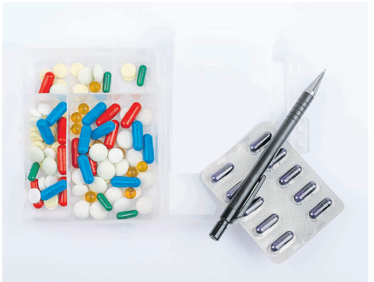
Rund fünf Prozent der Studierenden nehmen Medikamente, Psychostimulanzien oder Aufputschmittel.

Experten stellen den „Hirndoping“-Mitteln im Hinblick auf Ihre Wirksamkeit ein durchwachenes Zeugnis aus – einen Tau-