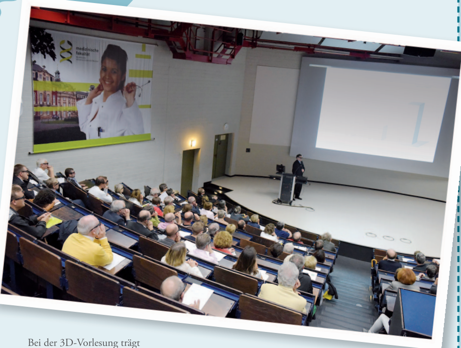
Bei der 3D-Vorlesung trägt auch der Dozent eine 3D-Brille.