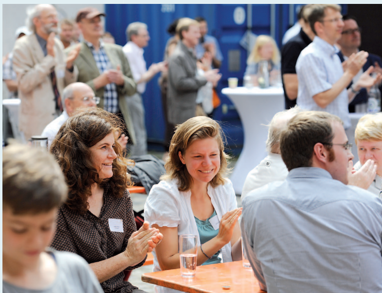
Ehemalige beim Alumni-Tag 2014 im Ehrenhof des Geomuseums.