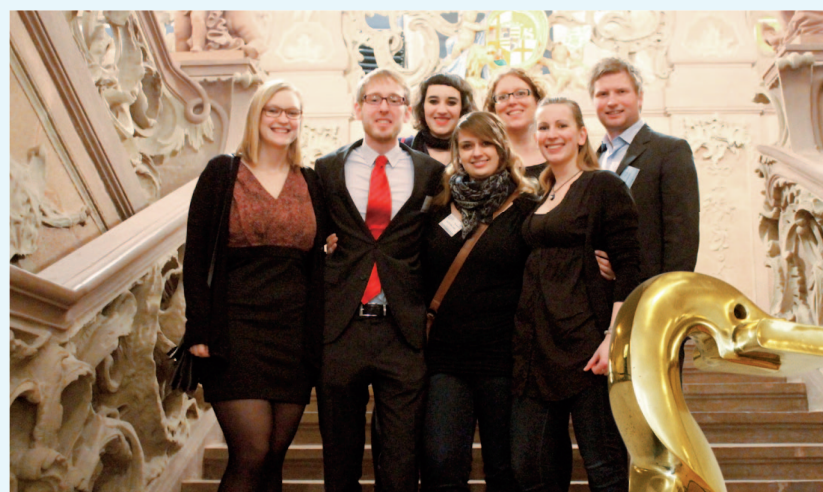
Das Team des Philipp C. Jessup Moot Court.

Freundeskreis Rechtswissenschaft e.V./tm