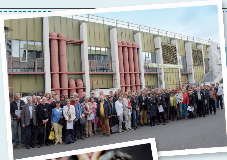
Gruppenaufnahme vor dem Lehrgebäude der Medizinischen Fakultät.