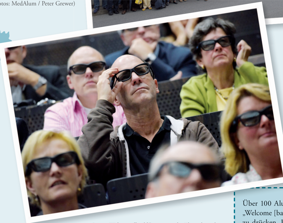
Beim „Welcome [back]“ staunten die Ehemaligen bei einer 3D-Vorlesung aus der Zahnmedizinischen Lehre.