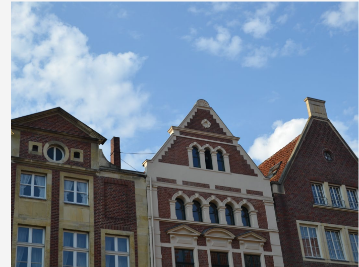
Uni MS - Sonja Zeggel