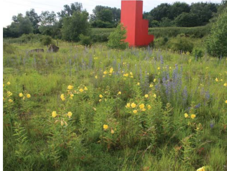
Abbildung 1: Blütenpracht der Brache Vondern mit Natternkopf und Nachtkerze

Befeuert durch die Umweltbewegung der 1970er und 1980er Jahre und initiiert von einem ornithologischen Arbeitskreis, gründete sich 1980 die Ortsgruppe Ober-