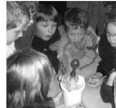
l: Flaschengeist-Versuch (aus Möller et al., 2007, 87) r: Luftballon-Flaschen-Versuch (aus Möller et al., 2007, 89)

Beim Flaschengeist-Versuch erwärmt man Luft in einer zuvor gekühlten Flasche, die man mit einer 50-Cent-Münze verschließt (wobei man zuvor den Rand des Flaschenhalses mit Wasser benetzt). Erwärmt man nun die Flasche mit den Händen, ist nach einiger Zeit ein immer wiederkehrendes Klappern der Münze zu hören. Die erwärmte Luft braucht mehr Platz, entweicht deshalb aus der Flasche und drückt dabei die Münze nach oben.