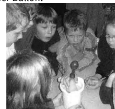
l: Flaschengeist-Versuch (aus Möller et al., 2007, 87) r: Luftballon-Flaschen-Versuch (aus Möller et al., 2007, 89)

Beim Flaschengeist-Versuch erwärmt man Luft in einer zuvor gekühlten Flasche, die man mit einer 50-Cent-Münze verschließt (wobei man zuvor den Rand des Flaschenhalses mit Wasser benetzt). Erwärmt man nun die Flasche mit den Händen, ist nach einiger Zeit ein immer wiederkehrendes Klappern der Münze zu hören. Die erwärmte Luft braucht mehr Platz, entweicht deshalb aus der Flasche und drückt dabei die Münze nach oben.