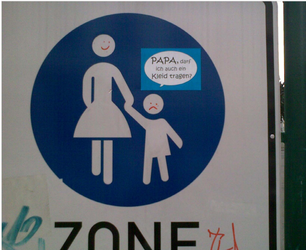
Auch so kann Sprache wirken: Streetart gegen Geschlechterstereotype

„Die Grenzen meiner Sprache bedeuten die Grenzen meiner Welt.“ Mit diesem Satz weist schon der Philosoph Ludwig Wittgenstein (1889–1951) auf den engen Zusammenhang von Sprache und Wirklichkeit hin. Sprache trägt in entscheidendem Maße dazu bei, wie wir unsere Welt wahrnehmen und wie wir sie gestalten. Ein zentraler Baustein einer diskriminierungsfreien Gesellschaft ist eine diskriminierungsfreie Sprache. Das kann auf verschiedenen Ebenen gelebt werden: Natürlich bedeutet es, verletzende Äußerungen zu unterlassen. Es bedeutet aber auch, keine Personengruppen zu verschweigen und so auszuschließen. Auf semantischer bzw. inhaltlicher Ebene umfasst diskriminierungsfreie Sprache, Stereotype zu vermei-