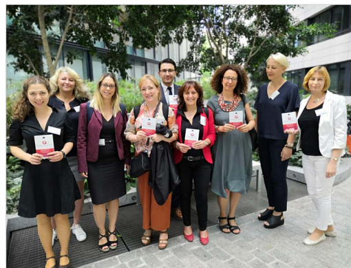
Abschlussstreffen EQUAL-IST am 17. Juli in Brüssel

(1) Herausforderungen bezüglich Gender Equality, Diversität und der Vereinbarkeit von Beruf und Familie zu identifizieren, als auch (2) vielversprechende Maßnahmen zu finden, um diese Herausforderungen zu adressieren. Anschließend wurden die zugeschnittenen Gender Equality Plans (GEPs) partizipatorisch entwickelt und von den Entscheidungsträger*innen der jeweiligen Institutionen abgesegnet. Dieser Prozess wurde mit Hilfe der CrowdEquality-Ideenplattform vereinfacht ( www.crowdequality.eu ), die von einem Team von acht Studierenden aus dem Bachelorstudiengang Wirtschaftsinformatik der WWU entwickelt worden war. Die GEPs enthielten detaillierte Maßnahmenpläne für ausgewählte Initiativen, die die identifizierten Herausforderungen adressieren.