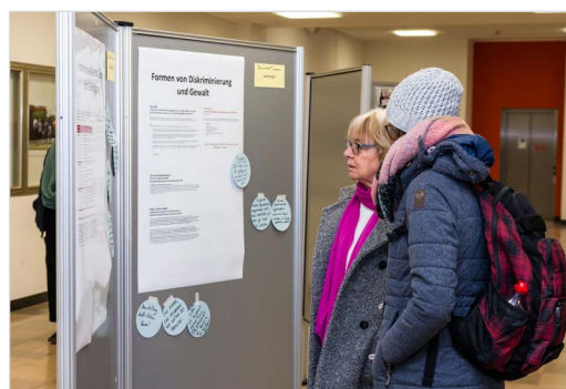
Besucherinnen der Ausstellung an der Mitmach-Wand

tionen, mit denen die WWU am 25. November Flagge gegen Gewalt an Frauen zeigte, und ergänzt durch Beiträge verschiedener (Fach-)Bereiche der WWU, die sich gemeinsam gegen Gewalt an Frauen positionierten, hat die Aktion informiert, sensibilisiert und gemahnt, Gewalt gegen Frauen als gesamtgesellschaftliches Problem und ihre Beseitigung auch als Aufgabe der Hochschule ernst zu nehmen.