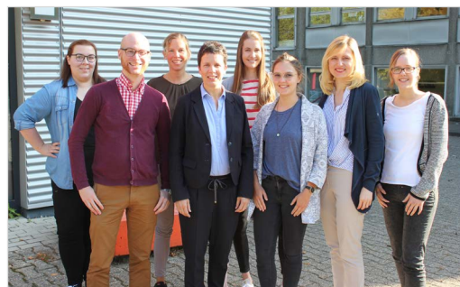
Das Team von Digital Me

Mädchen und junge Frauen können auf der entstandenen Webseite IT-Berufe spielerisch kennenlernen. Gleichzeitig kann auch die Vielfalt der Möglichkeiten im IT-Umfeld entdeckt werden. Neben Hintergrundinformationen zu den einzelnen Berufsfeldern, einem Diagnostik-Tool zur Selbsteinschätzung von Interessen und Kompetenzen sowie passenden Spielen, die typische Tätigkeitsfelder