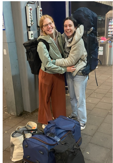
Abbildung 2: Münster verließen wir mit großem Reisegepäck voller Lern- und Freizeitmaterialien

In den kalten Novembertagen erhielten wir dann endlich die Praktikumszusage und freuten uns riesig! Schon in der Vorbereitung war es hilfreich, gemeinsam planen zu können. In den Monaten vor dem Abflug erhielten wir zahlreiche Reiseimpfungen, beantragten Business-Visa für 250 US-Dollar (trotz des unbezahlten Praktikums benötigten wir eine Arbeitserlaubnis) und strukturierten unser Unterrichtsmaterial. Da der Schuldirektor leider sehr schlecht erreichbar war und auf Emails erst nach einem Monat antwortete, entschieden wir uns, das Praktikum breit aufgestellt anzutreten. Eine gewisse Gelassenheit in der Vorbereitung hatten wir mittlerweile.