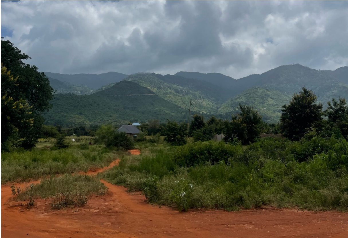
Abbildung 1: Gelegen in der Kilimanjaro-Region, ist die One World Secondary School von kleineren Bergen umgeben.

In den kalten Novembertagen erhielten wir dann endlich die Praktikumszusage und freuten uns riesig! Schon in der Vorbereitung war es hilfreich, gemeinsam planen zu können. In den Monaten vor dem Abflug erhielten wir zahlreiche Reiseimpfungen, beantragten Business-Visa für 250 US-Dollar (trotz des unbezahlten Praktikums benötigten wir eine Arbeitserlaubnis) und strukturierten unser Unterrichtsmaterial. Da der Schuldirektor leider sehr schlecht erreichbar war und auf Emails erst nach einem Monat antwortete, entschieden wir uns, das Praktikum breit aufgestellt anzutreten. Eine gewisse Gelassenheit in der Vorbereitung hatten wir mittlerweile.