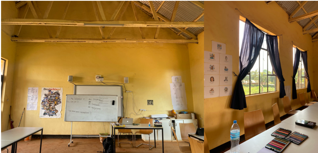
Abbildung 3: Der Deutschraum verfügt über eine umfassende Ausstattung, die das Goethe-Institut finanziert hat.

wir, so oft es ging, mit den anderen Lehrkräften und Schulfächern, doch wäre insgesamt natürlich eine bessere Ausstattung in allen Räumen erstrebenswert.