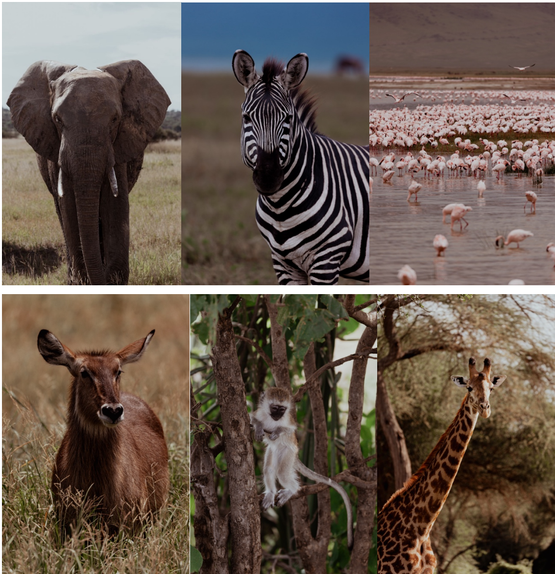
Abbildung 7: In den Nationalparks beobachteten wir faszinierende Tiere in Freiheit.

Außerdem diskutierten wir mit unserem Ranger Derek auf Swahili und Englisch, inwiefern der Safari-Tourismus Vor- oder Nachteile für den Tierschutz in den Naturparks habe: Einerseits werden die Tiere durch die Jeeps natürlich gestört, andererseits wäre, ohne die hohen Eintrittsgelder der Tourist:innen, der Kampf gegen Wilderei keinesfalls möglich. In den letzten 15 Jahren haben sich Tansanias Tierbestände, besonders an Nashörnern und Leoparden, deutlich erholt.