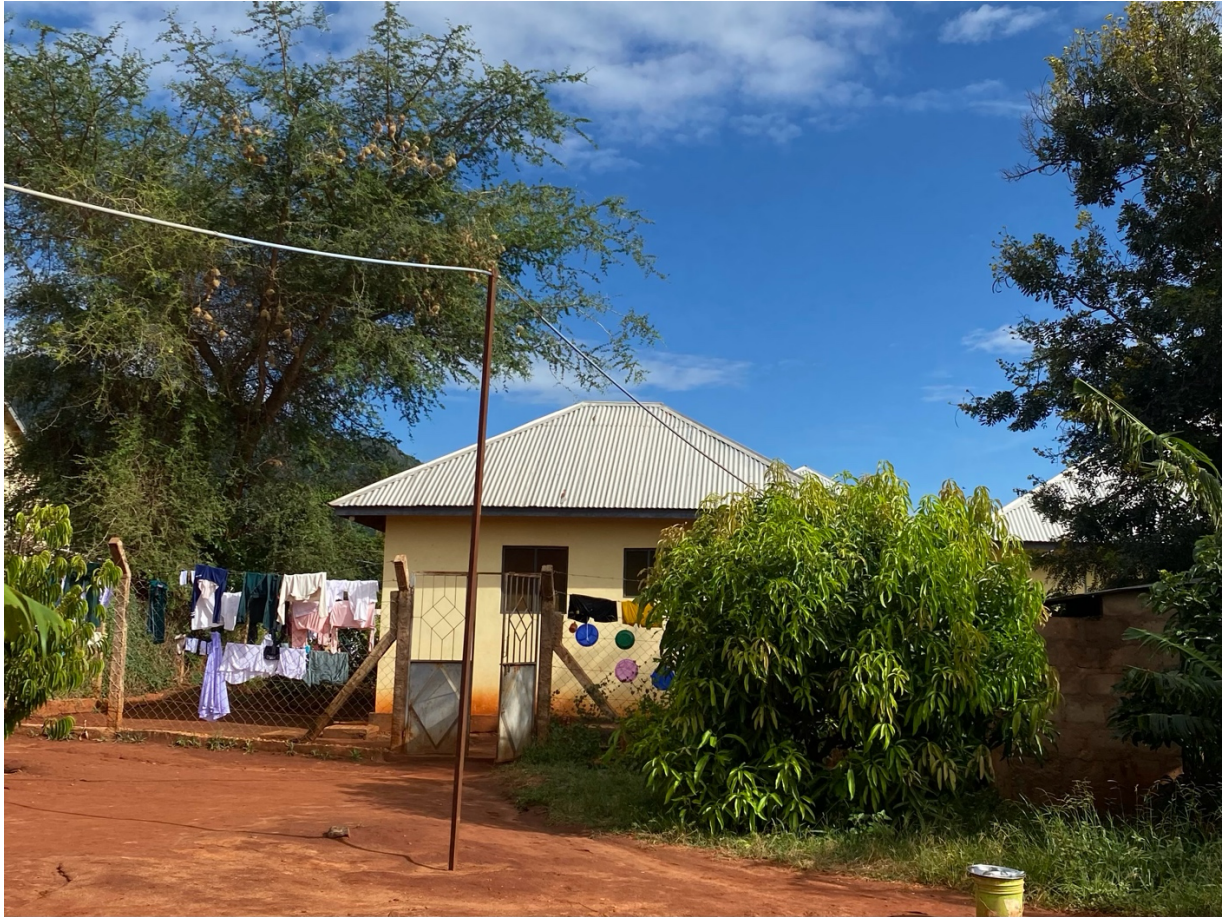
Abbildung 4: Vor dem Schlafsaal der Mädchen trocknen Kleidung und Geschirr im Zaun.

Zu Beginn übernahmen wir einige Deutschstunden sowie außercurricularen Englischunterricht für verschiedene Kleingruppen. Dies war besonders notwendig, da auf den staatlichen Grundschulen, auf die die meisten Schüler:innen gegangen waren, nur ein sehr unzureichender oder gar kein Englischunterricht erfolgte. In allen Sekundarschulen wird jedoch die offizielle Landessprache Englisch als Unterrichtssprache vorgeschrieben, sodass viele Lernende enorme Sprachschwierigkeiten haben. Diese Diskrepanz kann gerade von Schüler:innen in ärmeren Verhältnissen ohne Lehrwerke oder Internetzugang nur schwer überbrückt werden, sodass wir hier sinnvoll unterstützen konnten. Zunächst noch mit Händen, Füßen, GoogleTranslate und ersten Kiswahili-Vokabeln, konnten wir schnell kleine Gespräche auf Englisch mit den Schüler:innen führen und sie in ihren Persönlichkeiten kennenlernen und fördern. Gerade die Tatsache, dass auch wir mit Kiswahili eine neue und strukturell sehr andere Fremdsprache lernten, schaffte eine Vertrauensbasis.