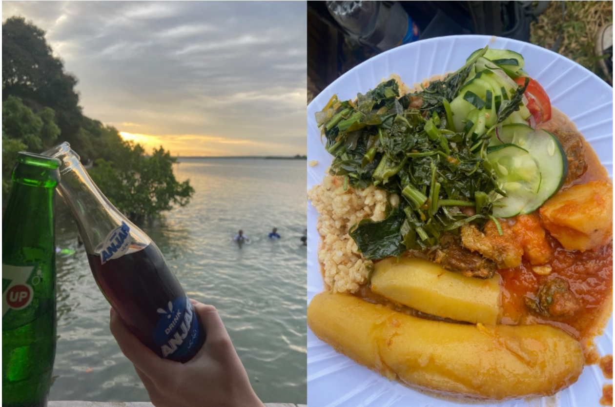
Abbildung 6: Planschen im indischen Ozean und ein Festmahl zu Mittag: Die Schüler:innen genossen den Ausflug nach Tanga sehr.

Da wir normalerweise im Schulalltag und auch am Wochenende sehr eingespannt waren, hatten wir relativ wenig Gelegenheit, die Umgebung genauer kennenzulernen. Ein verlängertes Wochenende bekamen wir jedoch frei, um eine Safari zu machen (eine für das studentische Budget durchaus kostspielige viertägige Reise – wir zahlten 650 Euro – doch gleichzeitig auch eine einmalige Chance, beeindruckende Wildtiere in ihrer natürlichen Umgebung zu beobachten). Wir reflektierten unsere privilegierte Situation, da die meisten Lehrkräfte und Schüler:innen, obwohl sie nicht den „weißen“ Preis zahlen würden, diese Gelegenheit vermutlich nicht erhalten würden.