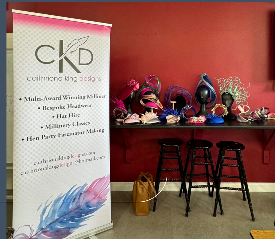
HUTMACHER WORKSHOP DER TYS