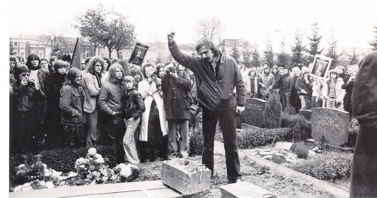
„Holger, der Kampf geht weiter!“ (Rudi Dutschke auf der Beerdigung von Holger Meins 1974)

Die Umkehrung des Dutschke-Zitats in der direkten Anrede Holger Meins' erzeugt einen polemischen Unterton